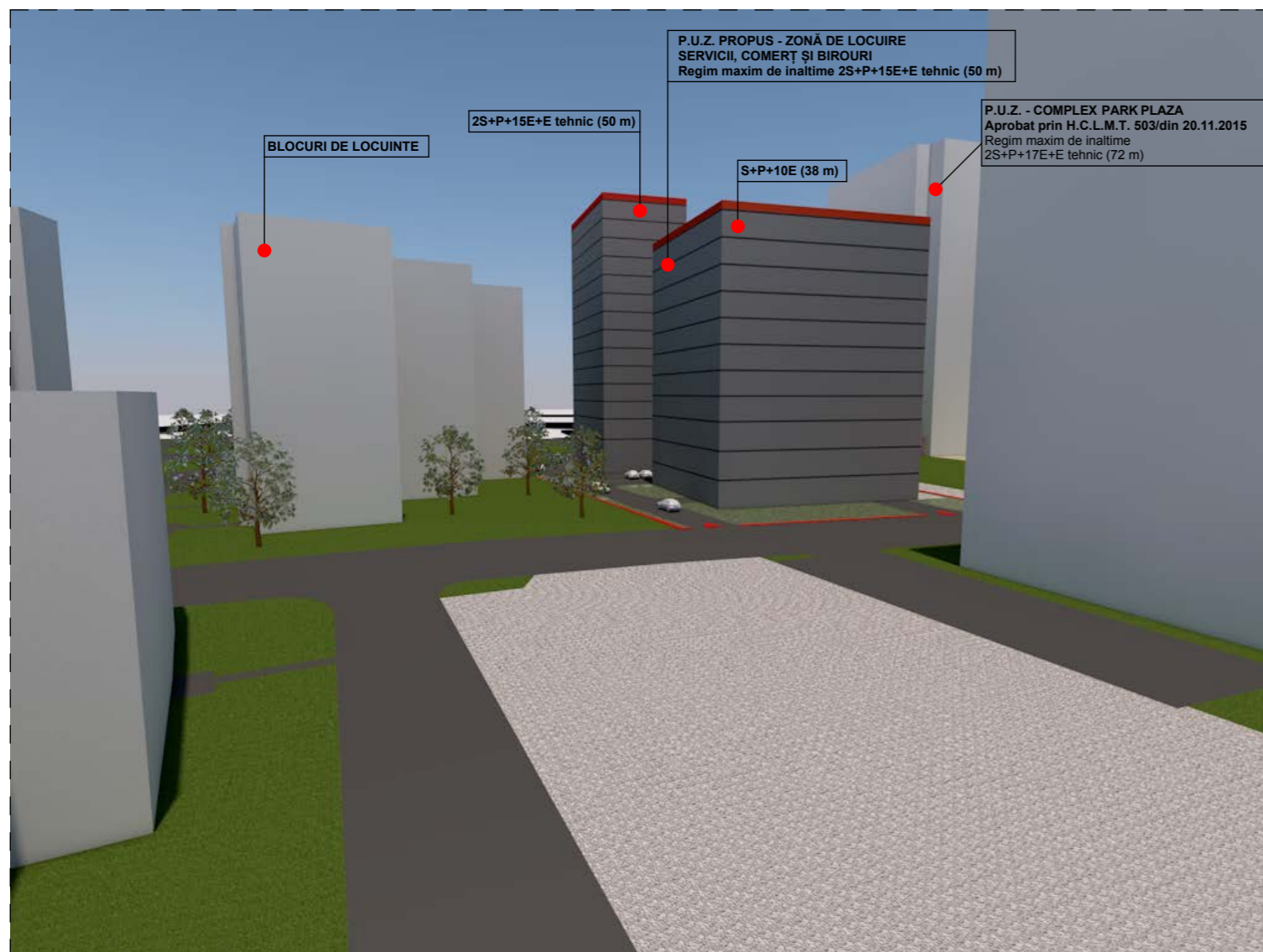
PERSPECTIVA DINSPRE STR. CIRCUMVALATIUNII